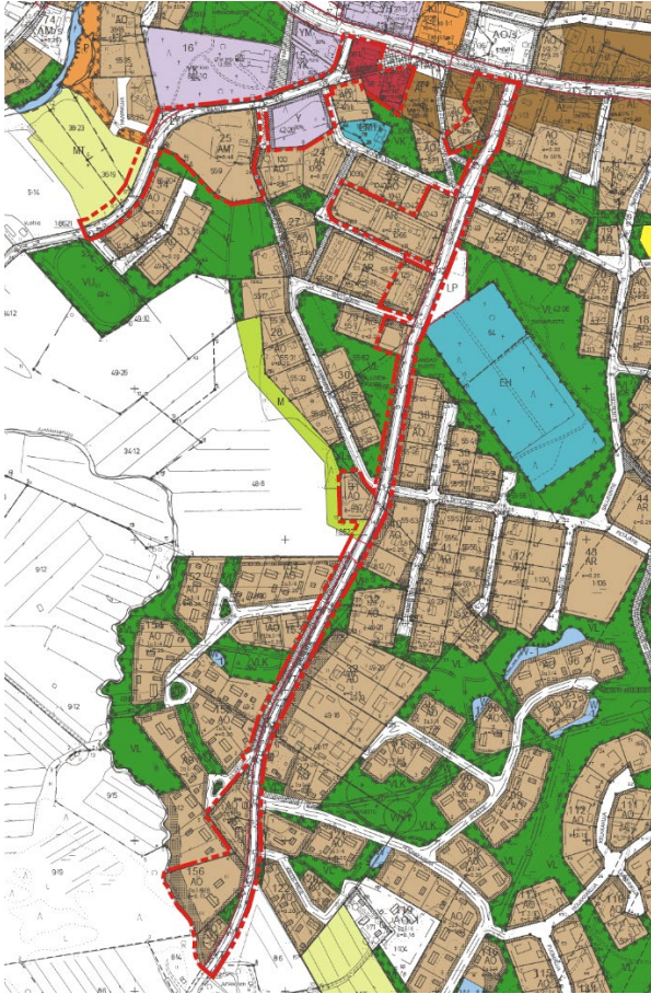
Kuva 3 Ote voimassa olevasta asemakaavasta.

korttelialueesta (AM). Ukuranperäntien kaava-alueeseen liittyy tiealueen lisäksi siihen rajautuvia asuinpientalojen korttelialueita (AO), asuin- ja liike-, ja toimistorakennusten korttelialueita (AL) ja rivitalojen ja muiden kytkettyjen asuinrakennusten korttelialueita (AR).